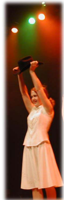
Stor glede på scenen, fra UKM 2002