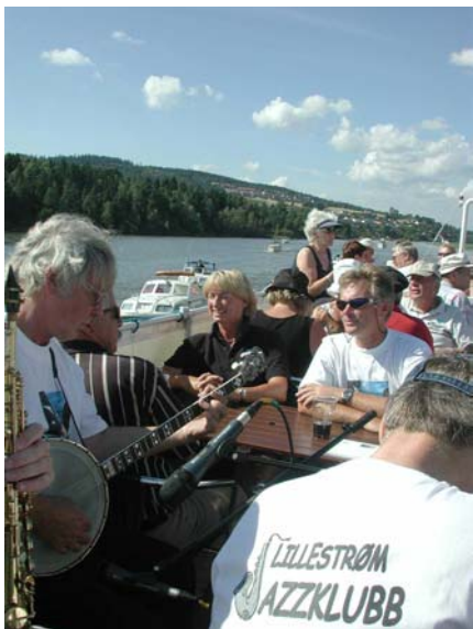
Fra "Deltajazz" på Øyeren sommeren 2002

Konsertaktiviteten i regi av de lokale musikklagene i fylket er meget høy, det holdes hvert år om lag 5.000 konserter der lokale musikklag er involvert (tall fra Vestlandsforskningens undersøkelse på begynnelsen av '90-tallet). Dette mangfoldet er i seg selv både en utrolig ressurs og viser en enorm bredde, samtidig som nettopp dette også kanskje er hovedutfordringen - det store antall konserter. Akershus musikkråd sin egen aktivitet på denne området er forholdsvis avgrenset og omfatter spesielle prosjekter som f.eks. konserter i sosiale institusjoner. Samtidig er rådets funksjon som kompetanse- og veiledningsorgan for lokale arrangører viktig, både når det gjelder praktisk gjennomføring, organisering, planlegging og økonomi - ikke minst veiledning innen forskjellige offentlige støtteordninger for konserter. Denne delen av rådets veiledningstjeneste er også hyppig brukt. En annen viktig del av rådets innsats innebærer tilrettelegging av forhold for konsertutøvelse og arbeid for å styrke rammebetingelsene, herunder bl.a. arbeid med konsertlokalene – spesielt de akustiske forholdene som tilbys utøvere og publikum. Et annet område gjelder samarbeide mellom amatører og profesjonelle utøvere, herunder bl.a. bruk av egenandelsmidlene fra skolekonsertene og andre offentlig støtteordninger der rådet blir tatt med på høring.