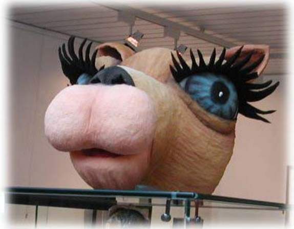
Fra utstillingen på UKM 2002

Ungdommens kultur mønstring – UKM - er et av musikkrådets viktigste formidlingsprosjekter. Akershus er fortsatt landets ledende UKM-fylke og har i perioden fortsatt økt den lokale deltakelsen. Det er nå over 2.500 ungdommer som deltar i de lokale mønstringene rundt om i fylket. Fylkesmønstringene er årets høydepunkt innen ungdomskultur i Akershus, og ble i 2001 holdt i Lørenskog Kulturhus og i 2002 i det nye kulturhuset på Årnes – der også fylkesmønstringen for 2003 skal holdes. UKMs lokalmønstringer er i de fleste kommunene meget godt besøkt, det er god deltakelse og stemningen omkring UKM lover også godt for framtida. For rådet utgjør også prosjektet en god mulighet til å komme i direkte kontakt med ungdom over hele fylket og får også et godt overblikk over det som "rør seg" i ungdomskulturen for øyeblikket. Den positive kontakten med de kommunale kulturkontorene gjennom prosjektet er også viktig.