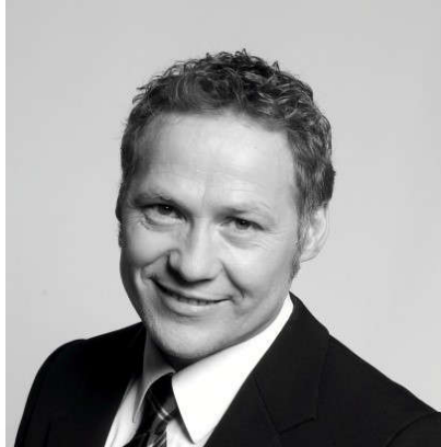
Helge Rønning - tenor