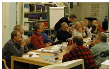
Fra munnspillkurs høsten 2004 – stor entusiasme og innsats hos deltakerne.

Den generelle utviklingen innen samarbeidet mellom musikklag og kulturskoler har i perioden stagnert hvis vi ser hele fylket under ett. Utviklingen fra musikkskoler til kulturskoler har på flere måter tatt bort fokus på musikkområdet de siste årene. Rådet arbeider med å gjenskape kulturskolenes fokus på musikk som genre, men det har vist seg at dette foreløpig har vært noe vanskelig å få til. Det er fortsatt vanskelig å få samarbeidet mellom kulturskoler og det enkelte lokale musikklag til å fungere godt over tid, her har både kulturlivet og ikke minst kulturskolene en stor utfordring. Den faglige siden i denne type samarbeid bør vektlegges sterkt, noe som etter hvert skjer stadig flere steder. Det er fortsatt behov for veiledning fra musikkrådet i slike saker, og samarbeidet med kulturskolene blir i denne sammenheng stadig viktigere.