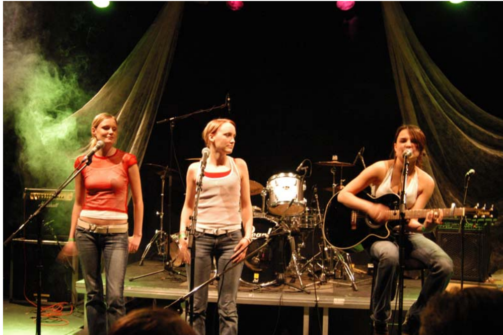
Fra UKM fylkesmønstring 2004 på Jessheim