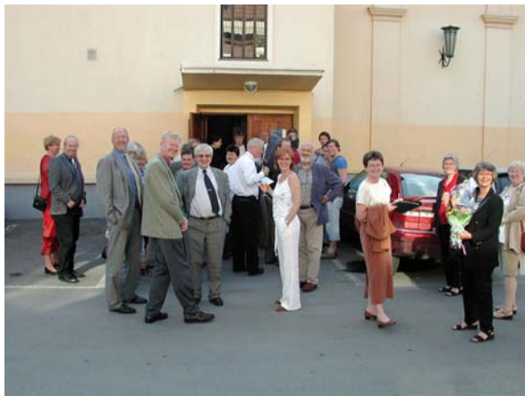
Hyggelig stemning på rådets 25-års jubileumsmarkering. Her utenfor Lillestrøm kultursenter.

I forrige periode var det store omorganiseringer i fylkeskommunen, bl.a. med etablering av kultur.akershus som fylkeskommunens kulturvirksomhet. Kontakten med det nye kultur.akershus har utviklet seg positivt i perioden og er nå stabilt og godt. Forholdet til den øvrige sentraladministrasjonen, gjennom seksjon for regional utvikling, er meget godt og utviklet positivt i perioden. Samarbeidet med både fylkeskommunen og kultur.akershus er fortsatt gjennomgående tett og godt, til gjensidig nytte og inspirasjon. Forholdet til Norsk musikkråd har i perioden blitt noe mer perifert, som en konsekvens av vedtak på landsmøtet i Norsk musikkråd i 2003 – der det ble vedtatt en mer selvstendig rolle for fylkesmusikkrådene. De interne samarbeidsforholdene med Norsk musikkråd har vært problemfritt i perioden. Dialogen med NMF-Akershus har i hele perioden vært tilfredsstillende – NMF-Akershus har fortsatt sitt sekretariat i Fetveien 1E sammen med musikkrådet selv etter utmeldingen i 2002. Den løpende dialogen på kontoret er opprettholdt.