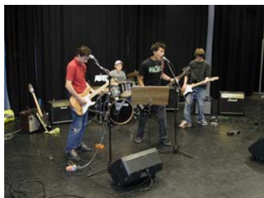
Fra bandsommerskolen "Full Vreng" sommeren 2004.

Uorganiserte grupper står for en vesentlig del av fylkets musikkliv. Dette er ofte grupper uten tilbud om opplæring, og rådet har som målsetting å bidra til et opplæringstilbud også for disse. Gjennom "Bandkontoret i Akershus" er det gjennomført flere kurs, bl.a. PA-kurs, kurs i bruk av Cubase, Musicator og studioarbeid og bandsommerskole – som en videreutvikling av Ungdommens Kulturverksted. Bandkontoret har også bidratt til en bedre utnyttelse av voksenopplæringssystemet for band.